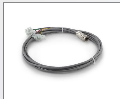
Câbles pour porte et lampe