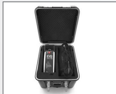
Caisse de transport pour pupitre de contrôle