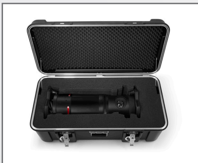
Caisse de transport pour générateur