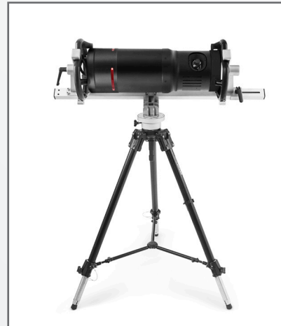
Support pour tube à 3 pieds Poids : 19 kg Charge maximale : 35 kg Hauteur mini foyer - sol : 118 cm Hauteur maxi foyer - sol : 183 cm