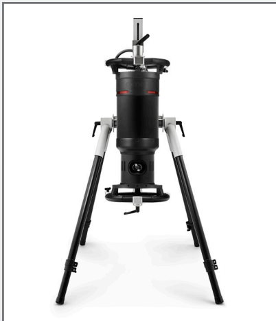
Support pour tube à 4 pieds Poids : 15 kg Charge maximale : 40 kg Hauteur mini foyer - sol : 53 cm Hauteur maxi foyer - sol : 156 cm

Ces supports facilitent le positionnement et la manipulation des systèmes portables RX. Une fois le tube monté sur le support, vous pouvez contrôler les éléments sous tous les angles, ce qui rend les expositions plus précises et rapides.