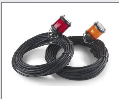
Lampes de signalisation